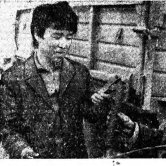
Удэр бүхэнөө—үндэр ургасада ТҮГЭС БЭЛЭН