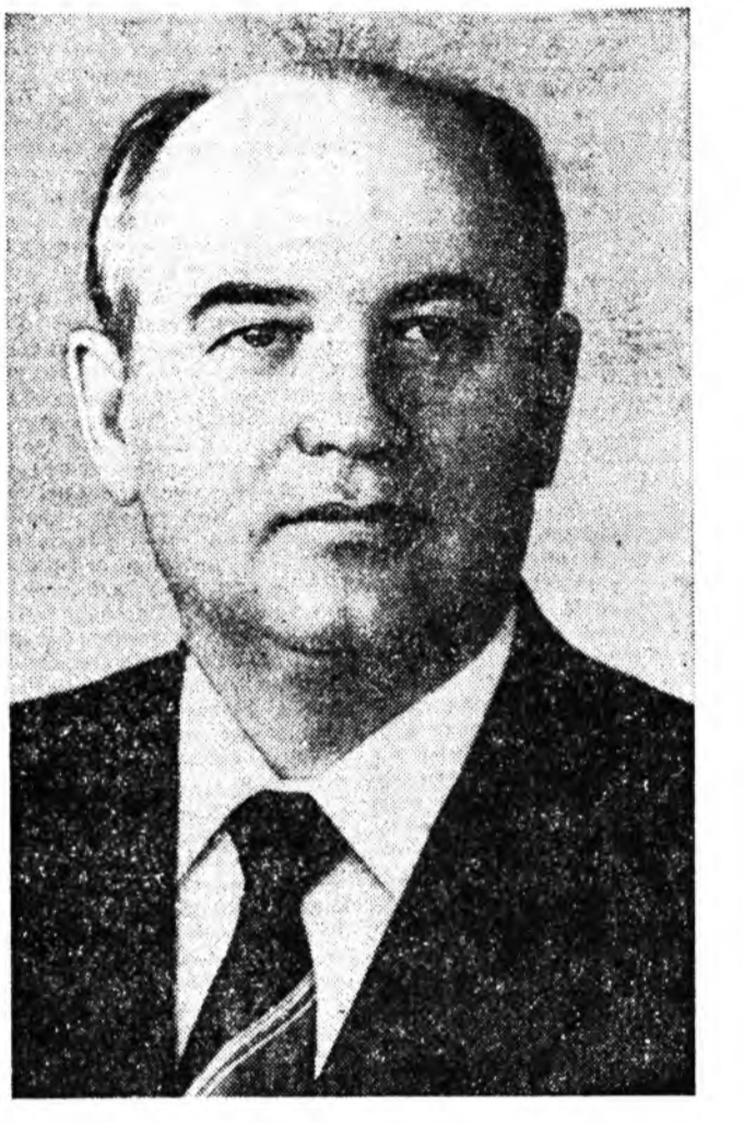
Михаил Сергеевич Горбачев 1931 оной мартын 2-то Ставрополин хизарай Красногвардейскэ районий Привольный тосхондо тарашанай булуд түрэнэн юм. 13-тайһаа колхоздо ажлажа эхилэ бул. 15-тайһаа МТС-эй комбайнерай туһалца болобо. Хурахага хамта поли дээрэ ажаллагдай байгаа. Москвагай М. В. Ломоносовой нэрэмжэтэ гүрэнэй университетидэ юридическэ факультет (1955 он), Ставрополин хууде ажлын институтидэ экономическэ факультет (1967 он) зоочоно дүүргэ.

Университет дүүргэһинэйгээ хүлээр турал ногагтаа хүлэжэ, Ставрополин хизарай юридическэ мэргэжлээрэ ажаллажа ахаалаа хэм. Удашуугүй тэрэ комсомолой хүдэлмэридэ дэжүүлэгдэ; ВЛКСМ-эй крайкомой пропаганда ба агитацион таһагыг дагалын орлогшо. ВЛКСМ-эй Ставрополин горкомой нэгдэх секретарь, ВЛКСМ-эй крайкомой хоёрдох, удаан нэгдэх секретарь хууде.