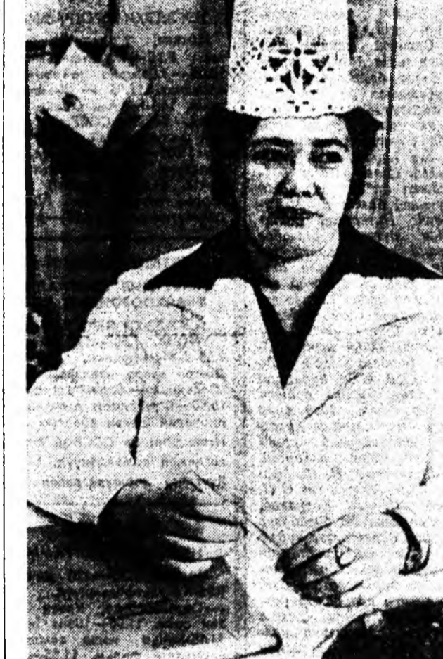
Улаан-Удын Октябрска районий рознично худалдаа наймаанай нэгдэлдэ 7 магазин оролодог. Тэдэний дунда худалдаа наймаанай 96-дугаа магазиний коллектив социализм мүрысөөлдэ түрүү үзэлнэ...