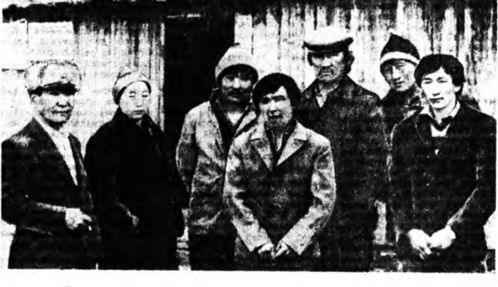
Мал ажал—онсо шухала халбари