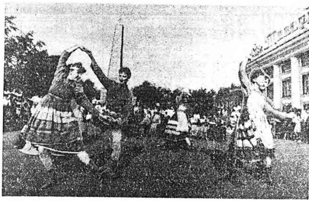
Амаралтын үдэрүүдэтэ үе-үе болоод лэ Улаан-Удын сээрлинг, талмайнууд дээр олон зоной номроондоо арадай уран найханай ансамбльнууд, бүлгүүдүд концерт наада табина, бэйлг шедабарна харуулга байдаг. Эдэ бүгэ хэмжээ ябуулганууд хадаа орон соомнай сохолодон арадай уран бэйлгэй заралгын гурбадах фестивалин хэмжээгээр эмхэдхэгдэнэ.

Гадна хүрэнээрнээ — Меть-Ордын ба Агын автономито округууднаа арыта эрхээр хүлээгдэнэ. Барандаа найндэртэ ерыт!