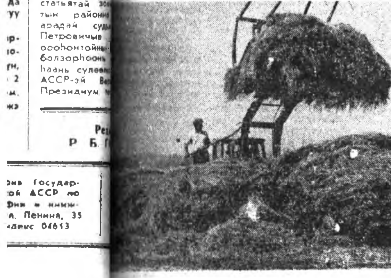
Энэ Государствой АССР-н Министр Л. Пенниа, 35-дөмс 04613

РСФСР-эй далай тухай статыатай закон дээр, тоогуудта, хуряага багадаа пунктуулаа, үдэ городой хуряага хуряага хабаатай нуга амжалда хүтлэгжэ үнэгэргэдхөөр хүлээгдэнэ. Ган гацуургагэжэ, болон ажамниудай таряалан горитой хохмолдо мүн зөвөөн ишгээдүгээр үбшэ тэжээл бэлдэхэд дунда ябуулагдана багша, ингээд хэдхэн хоног хуряага халуун хүдэлмэри эхлэжэ, таряаша хабаа харуулаха хаа орохоё байна. Энэ республика соо ургаса хуряага орёо бэрхэтэй үбшэ тэжээл бэлдэхэд үнэгэргэдхөөр хүлээгдэнэ. Ган гацуургагэжэ, болон ажамниудай таряалан горитой хохмолдо мүн зөвөөн ишгээдүгээр үбшэ тэжээл бэлдэхэд дунда ябуулагдана багша, ингээд хэдхэн хоног хуряага халуун хүдэлмэри эхлэжэ, таряаша хабаа харуулаха хаа орохоё байна.