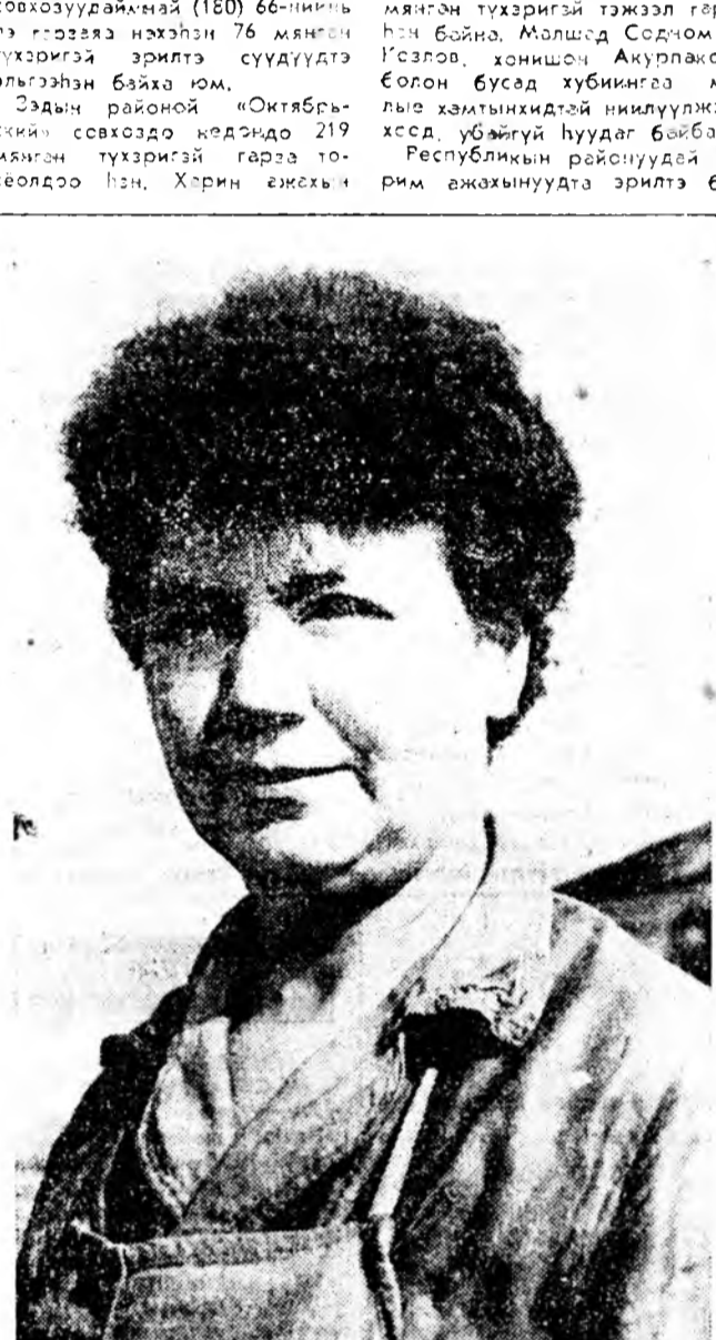
Уннэй хүдэлмэришэн-хурган хүмүүжүүлэгшэ. Хягштын районийн Сүхэн арнайа заводой үннэй хүдэлмэришэн...