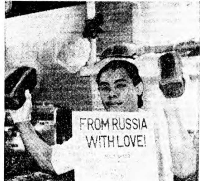
НЬУ-НОРК. «Московский» гэж хэрэ «Бородинский» хиллэмнүүд «Зарос» худгадаг наймааны фирмэдэ тон гүрээ...