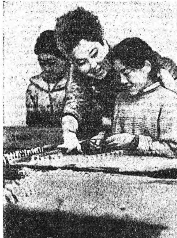
Иймэ гасалгаар ехэ адалтай байдал үзэгдэдэ, өөхдөн дундаһаа галадуу отого зөһөн Буган Турекин тургуулы отог бүрэн нэхээд сөлдөөр нүхдээгээр эмээл мөөр 1702 ондоо ээний нислэг хото Москва ерхэ, тэдэ бээ дээд ээни император нэгдүгээр Пётр Алексеевич тэдэ барилхан, бүгдээрээ толгойгоороо газар сохин үүрэг мургаж, анхан эртэ сагта хашан гэжэ эрхэн ба албата болжо түшэн, тингээд мүнөө сагта шөдөрхи хөгсүүд ба тарашадтай зүгөө тинхэ олон зүйлэй хөшөлөн үзүүлэгдэ, хэсүү гасалдаа элэрхэлэй, тэрээнэй хошоо элэрхэлэй, энэ үйлэй хашалчуудһаа аршалан айлагдаа, хэтээд газар нотагуудһаа сүлөөтэй элдэж, амьрхан жөргөжэ нүүхэн хайра уршоовые гуйхан ажай.

Туралхын бэлтгэ шадабары харуушаг абад даа. Харин интернат тургуулхын үйлбүрд 1-дэхи класста эхилдэг.