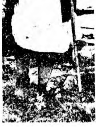
Хүн зонгүй худаа ноте. Га... зэр буугаа орошдон хүрүү...