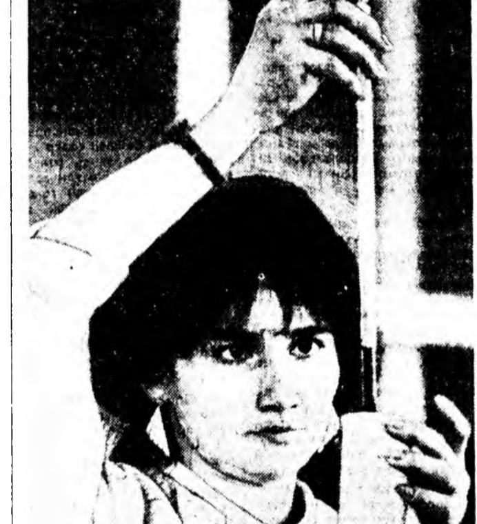
Халиса Салбарова Томенин индустриальна институт дүүргэд...