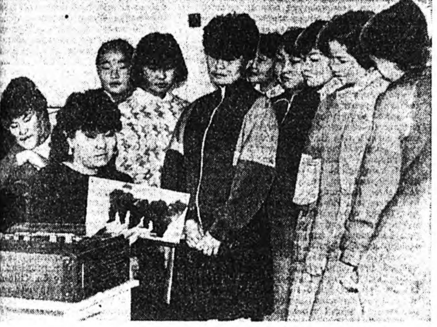
Туралхын бэлтгэ шадабары харуушаг абад даа. Харин интернат тургуулхын үйлбүрд 1-дэхи класста эхилдэг.