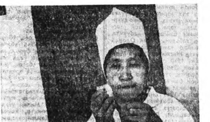
Хүн ба үе сар