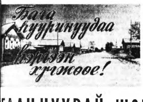
Хүн ба үе сар

Манай газетын сентябрийн 7-ной номерто «Нэрэ нэрээрн Дурсал гэдэн гаргатай мэдээсэлнүүд» гэдэг тэдгээрийн нэг болно.