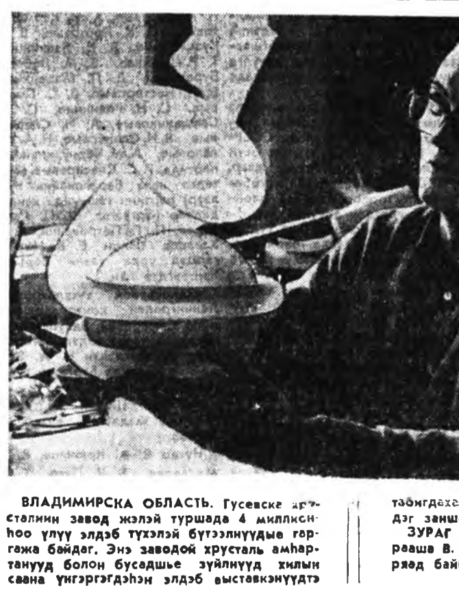
ВЛАДИМИРСКА ОБЛАСТЬ. Гусевске аргэсталин завод жэлэй түрэдэ 4 амилсын хоо үчүү элдэб түрээшэ бүтээлүүдэ гаргана байдаг. Энэ заводой түрээшэ амьлтанууд боло бусадые зүйнүүдэй хилин савна үнэгэрэгдэн элдэб выставкунуудтэ табидагдэв, үндэр сэгилтэнүүдтэ хүртэ дэврэнэ.