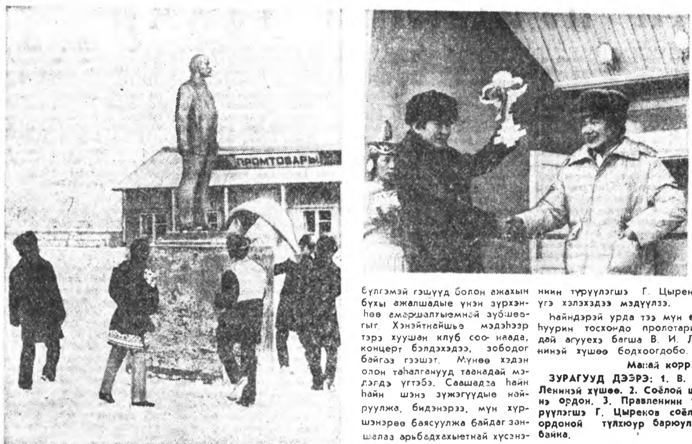
Бүлэмэй гашууд болон ажахын үгэ хэлэхэд мэдүүлэ. Хайндарэй урда тээ мун энэ хуурин тосхондо пролетариатай агухуэ багша В. И. Ленинэй түшөө болдооголобо.