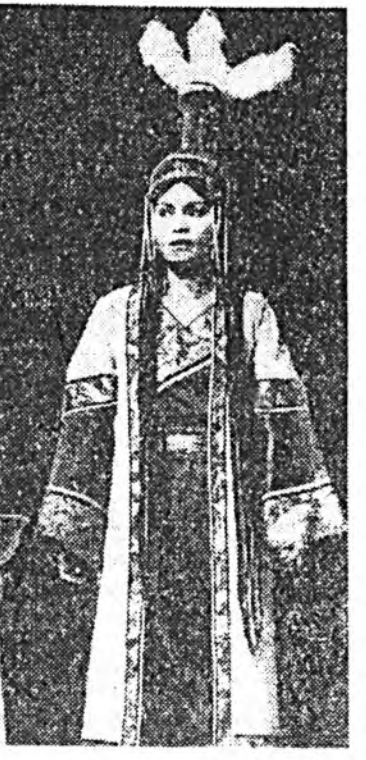
Хэжэнгын районы Загатаа тосхойн тогтоһон 100 жэлий ба Чисаанын хуруулинькин би боллоһор 75 жэлэй ойхүүд наһаг тэмдэглээдэ.

Зүжгэй үдхне боогоноор тайлаб рилбал, имижүүр байна. Хүн зоной хуби заяа өөрчлөгөө мээлээд абалд арбан табан тархитай Асуурин мангас хубуугээ тэмэжээ байһэн Эмгэн шолмос эргоороо аашална. Арбан табан тархитай селваа дэбтээх юм бэшэ, Эмгэн шолмос уурлага аба аад, үшөө булз хүнүүдэй асаруула. Зоболонто хэрэгээ үнөөчын үрбхичээл мээдээ юм. Арбан табан тархитай аймаштай амитание зураглан харуула талеар уран зурааша мантан томо багуудые улажа, мэргэн арга олоо байна.