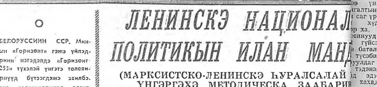
БЕГОРУССИЙН ССР, Минский «Горизонт» гэжэ үйлдэбэрин нэгдэлдэ «Горизонт Ц-25» тухэлэй үнгэтэ төлсөб зорилгуд бүтээгдэжэ эжилсэ. Шэнэ төлсөб зорилгуд электорын элшэ хүсэ хөбр дэхин багсар хэрэгтэнэ, 26 кинограммээр хүнгэн.

Хөблөлэй, полиграфийн болон ном худалдаагийн талаар КПСС Союзай Гүрэнэй комитетдэй дамжуулгын Улаан туг байгуулга багтаагдай хүн хэблэлтэдэ баруулгадаа. Манай полиграфистууд КПСС-эй байгуулгадаа 60 жэлэй ойн байрлай хүндэлдэдэ дэлгэрэн социализм мурьсоонд хабаагдаа, үзсөб, уйлангуудаа үлдүүлэн дүргэлэйнхэнхээ туслоо энэ үндэр шагналда хүртсөө. Профессор, академик, академик дүргэлэйнхэнхээ туслоо энэ үндэр шагналда хүртсөө. Профессор, академик, академик дүргэлэйнхэнхээ туслоо энэ үндэр шагналда хүртсөө.