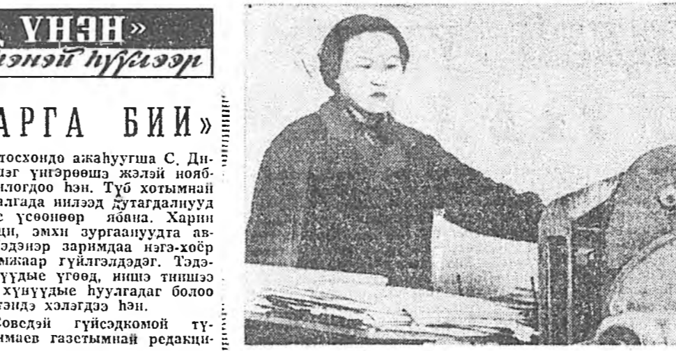
Багдариний тирогофид 4-д...

Гэбэиш малаашиде меди Хороьд жэлэй туршада Жолооноор аналлажа бай