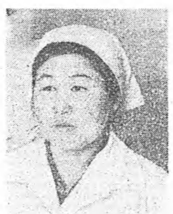
Түнхэнэй районной Тооро тосхондо байдаг участково больница шэнэ байрада найман нүүжэ ороно. Уулзал салуу энэ байран нэгэ хадхата 35 оронтой стационар, нүүгөө хадхатан 9 кабинеттэй поликлиника түбхнэй хэй. Энэ больница Тоорын болон Далахан сомоной Советуудай газар дайда дээр байдаг хуурын, тосхонуудай хун зонине хангаха юм.

Шэнэ больницын үүдэ талһаа ороходо, харуул, дурлаан, ариг сөбд оршон байдаг анхаралдаахна. Хана болон потолоогшын шугатууригдажа сагаадагланхай, зонхо болон поостын атайт охидоор шэрдэгдэнхэй, ууралаар дулаасуулагдаха.