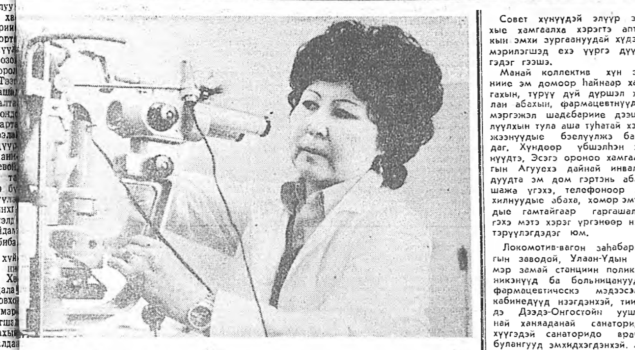
Совет хунүүдэй элүүр энхэ хамгаалха хэрэгтэ өткэвин эмхи зургаануудай худалмэрилэгшэдэ эхэ үүргэ дүүргэдэг гэсэе.

абадаг юм. 1982 ондо дайна инвалидуудта 1777 тухэриг, тухайта пенсионернуудта 863 тухэригэй эмүүд үгөөе. Антекхимий коллектив үнгэржэ жэлдэ тусбэе гадур 21 мянган тухэригэй эм дом худалдажа, тусбэе хооло үлүүлэн байна. Тиххэдэ 620 мянган ролетээр эм үгээ тусбэи аад, 771 мянган ролетээр эмүүдыс тараан үгөөбди.