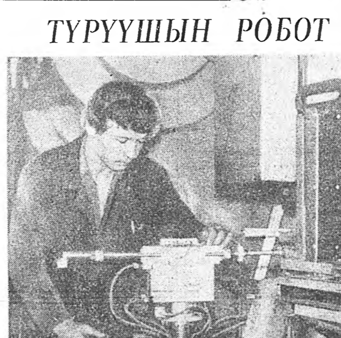
Заводой мэргэжэлтэд хүдэлмэришэдэй тууалагша болон шэнэ түхээрэлтэ үл- лэдэрхөөд хэрэглэхын тула нилдэгүйхэн оролдолто гар- ганан байна.

«Теплоприбор» заводой бэлдэхэлгын цех соо робот-манипулятор тодхогодо, заводой хүдэл- мэришэдэй дунда хонохолт татаба.