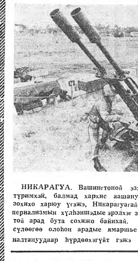
НИКАРАГУА. Вашингтоной ээрхэг турмхэй, балмад харнис аашануудта зонхю харюу гэжэ, Никарагуагай имперализмын хулхэншэдые эрхлэгэ зорилгой арам бута сохино байхай. Эрхэ сүлөөгөө ололон арадые ямаршые заналтануудаар хүрдөөхэгүйт гэжэ хаа

Улахоорондони байдалтай орбо түгшүүрлэтэй боложо байхан ушар наанаемнай эхээр зообоно гэжэ Индин Премьер-Министр мэдүүлэбэ. «Даралта мүлжэлгэнэ нүдөөлэ зорилгоогоор импералист гүрэнүүд бусад оронудые политическэ, экономическа ба бэшые таллаар хайра галмүгөөр хашана харшана», — гэжэ тэрэ тэмдэглэнэ байна.