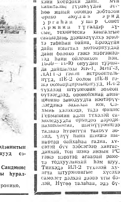
1939 ондо эхилдэн дэлхэйн хоёрдохой дайн. Мун капиталыс гүрэнүүдэй зүгөө манай орондо долоон орохо аюултан эридэ урханай ушр Совет Армиини түгэлдэр хүсые, техническэ хангалгые саашадан дээшлүүлэхэ эрилтэ табилан байна.