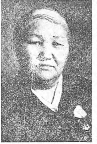
жагаламхай ябадалыя нанан дурсан хөөрлэдэгэ заншалт болонхой.