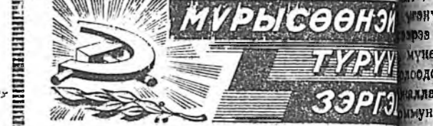
МҮРҮСӨӨНЭЙ ТҮРҮҮШҮ ЗЭРИГЭ

Эсэгэ ороноо хамгалгын Агууэхэ дайнай нивалидууд, олон үхкүүдтэй гэр бүлүүд, дайнда наа оарлан хүнүүдэй гэр бүлээр болон бусад мунөө дээрэ бултада гэр байраа хангалданхай.