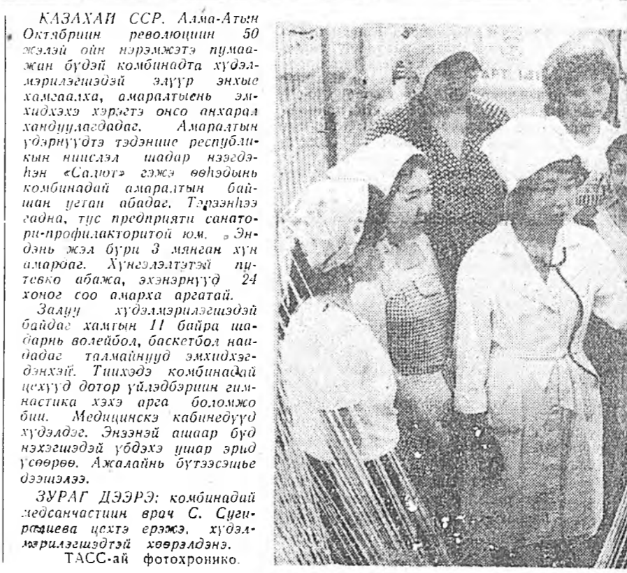
КАЗАХАН ССР. Алма-Атын Октябрийн революцион 50 жэлэй ойн нэрэмжэтэ гимназиян бүдэй комбината худалдмэрилгшэдэй эдэр энгые халсаалха, амаралтын эмхидхэ хэрэгтэ онго ангарал хандуулагдаба.

БЕЛОРУССИИ «ХОЕРДОХИ ХИЛЭЭМЭН» МИНСК. Эдэ хоолой энэ ургамалы орондоо эгээл сазар тушаагдэ цеоруссин ажанууд урьдынханаа нураггүй урид харагдаха хурмаа дүүргэжэ, мэргэжлэй һандиртөө —Алдоо «МАНХИ» худалдмэрилгшэдэй үдэртэ тарашад энэ амжалтаа зориюула.