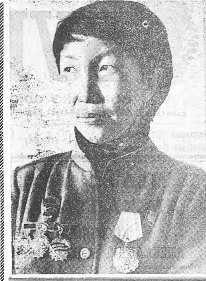
КПСС-эй XXVI съездын шийдэхэдэй түгүүрүбө бөдөлүүхын мүсөө

Угһарһан тоосоотой үсөо нитын малай ашг шэмээ дэвшээлүхэд арга боломжо нуушдыс бин байгаа гээд тэмдэглэе.