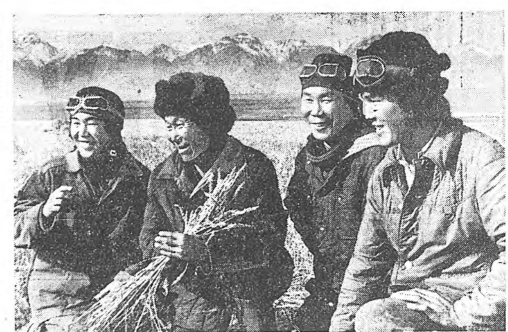
Ходоодо буурал сагаан толгойтой хандуулай хала туласа нэмжнэй...