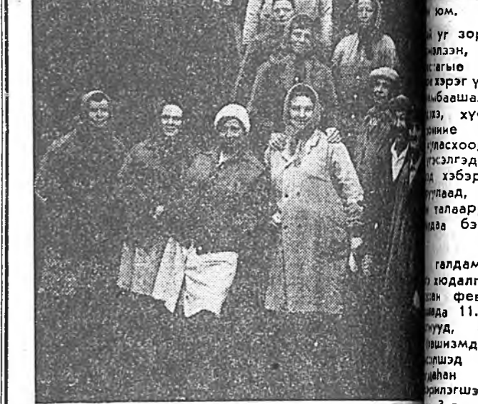
ХЭЛЭХЭНДЭЭ ЗААТАГУЙ ХҮРЭДЭЭ