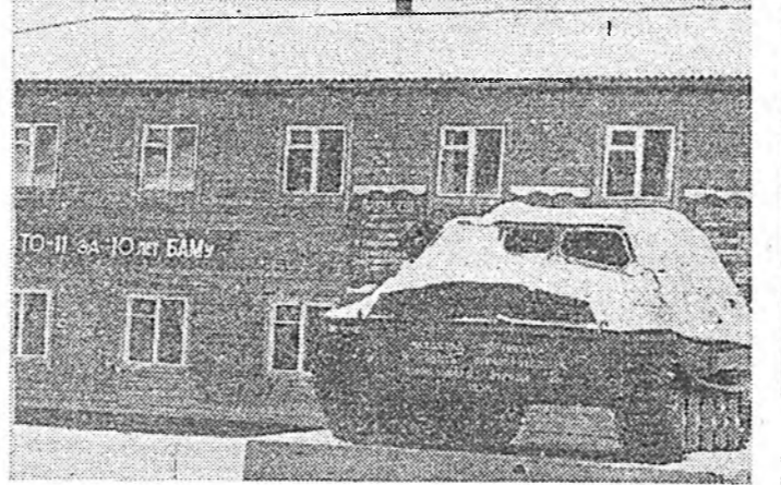
ТО-11 «Юг БАМ»