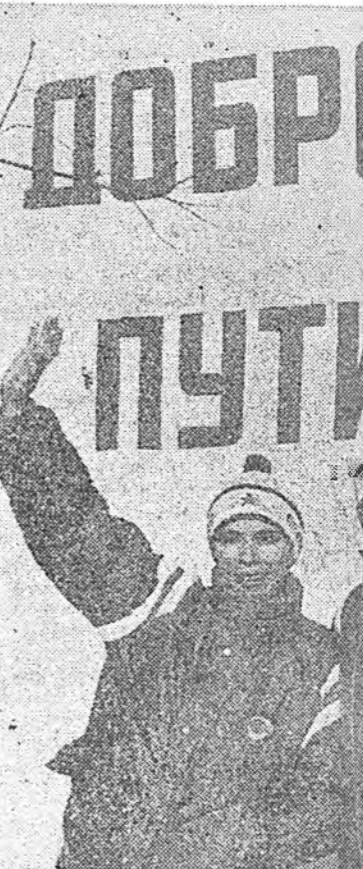
Олимпийн үбэлэй наада- гүүдэ охижэ дүтгэлэ. Олимпийн наадагдуудта бэлдэхэд...