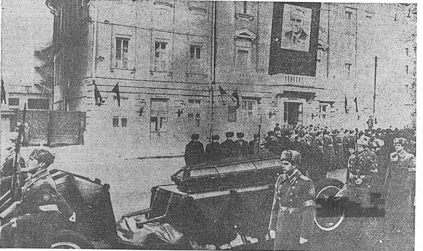
Улаан талмай дээрэ болоһон шаналал гашуудалай митинг. Зураг дээрэ: В. И. Ленинэй Мавзолейн трибуна дээрэ.