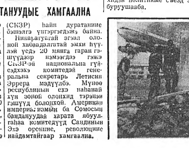
Уулаан-баатар тусхай хургалдгэ болонохой.