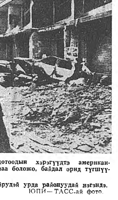
ЛИВАН. Оройной дотоодын хэрэгүүдтэ американи-заривалин замаарлагана боложо, байдал өрнд түгшүү-рилтой болоно.

ВЕНЭ. ОО-ной бүхэдэл-хэйн конференцид бэлдэжэ байһан эхээрхүүдэй байдалыг шинжлэхэ ОО-ной ко-миссин тусхай хоёрдохи сес-си Венэдхэй уласхорондын түбтэ нээгдэбэ. «Адил тэг-шэ эрхэ, хүгжэлтэ, эб бай-рамдал» гэрэн урда доро 1976 онһоо 1985 он боло-тор үнгэрэгдэжэ байһан эхээрхүүдэй арбан жэлэй дунгууд тэрэн дээрэ согсо-