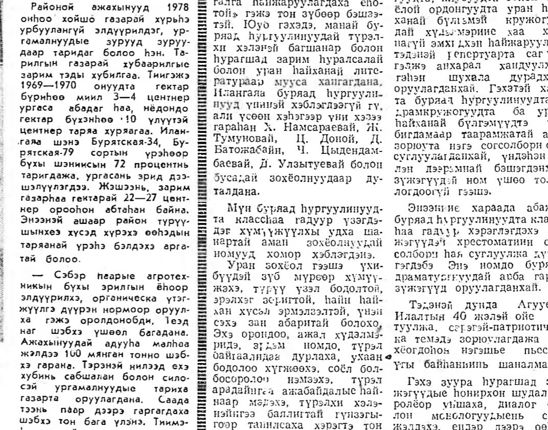
Районий ажaxyнуд 1978 оноо хойшо газарой хурьтэй урбуулгунг элдурилдэг, ургамалнуудыг зурууд зуруудаар тардаг болохын. Тарилгын газарий хубаарилгы зарим тэдэ хубилгаа. Тингэж 1969-1970 онуудта гектар бүриөө миил 3-4 центнер үргасэ абагдахын, нөндондо гектар бүриөөнөө 10 үлүгэй центнер тарга хурьяага. Илангаяа шэнэ Бурятскыя 34, Бурятскыя-79 сортын үрчлөөн бүхы шаниксын 72 процентий таригаага, ургасгын эрдэ дээшүүлгэдэ. Жэжээни зарим газарнаа гектарай 22-27 центнер ороолон абтахан байна. Энээнэй ашвар район туруушынхэ хусад хүрэхэ өөһэдн тарьянай үрчлэ хэрэгтэ аргатай боло.