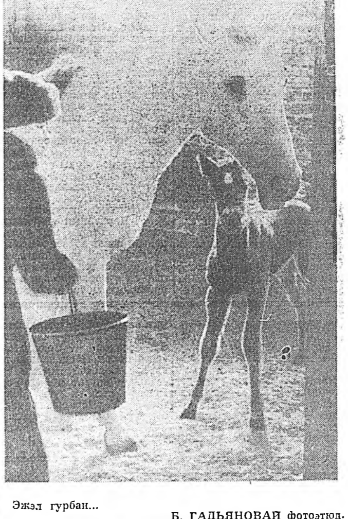
Эжел гурбат...