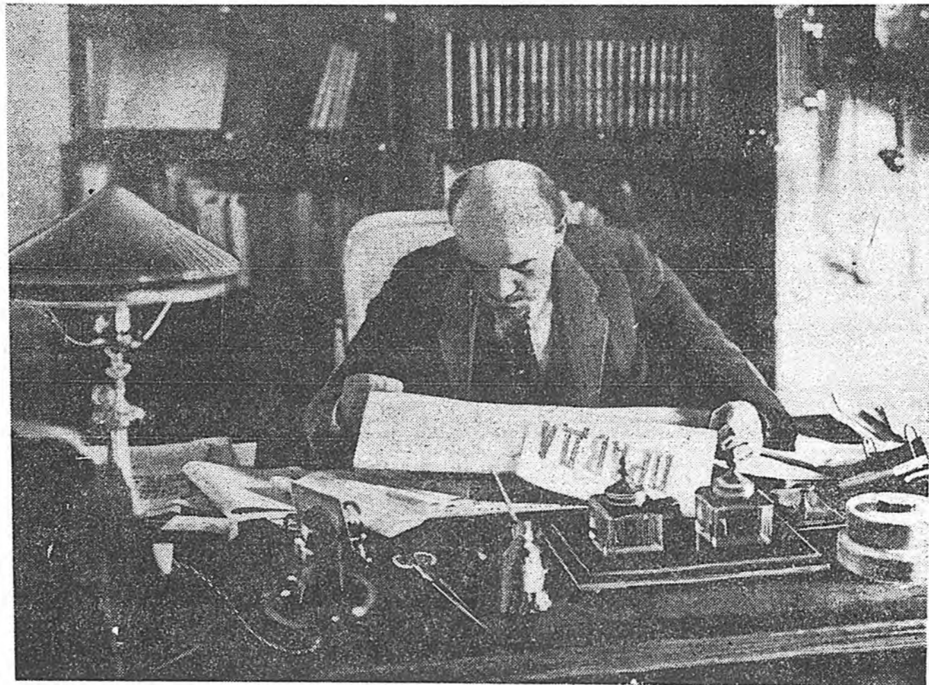
В. И. Ленин Кремльдэх кабинет соого.