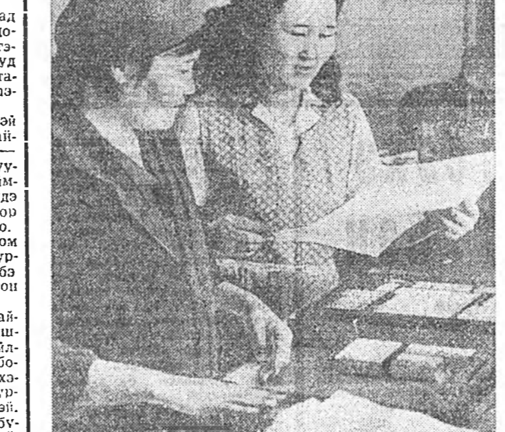
ЭДЭНЭЙ ОРОЛДОЛГООР ГАРАНА

буамнай болонхой, Партиин райкомой ашарадай хүдэлмэрилгэгшэд газетингээ хууданангаа нэгэнтэ бөшэ ажаллаа сондоо хандадаг. сагай эрилтын үндэһөөр хараа зорилгонуудынь тодоруулжа, зүб шөгдөлөөнь саажа үгэдэг байна. Иүгөө талаана, ажалшадан банаал хүсэлтэ элэрүүлжэ, тэдэнэй нуудал байдалтай бүхы хэрэглэмжэ, эрилтэнуудынь тодорхойлоо, нүүлээрн дары хэмжээ абаха зорилготойгоор нээмэл бөшгээн үдэрнүүдэ «мхид» хээ нэмдн. Районийнай олон нууринда инмэ үдэр үнэгэрэгдэжэ найшаагдаад, саашадаа дэмжэгдээц байна.