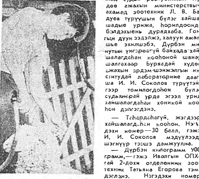
Улаан-Үдын нарин сэм-бын комбинадай соёлой байшанда республиканы хонин үгсэбэригдэг районундай, ажабууруудай, мун үүлгэртэ мал үсэхээрлэгдэг предриятнууд болон кооперативуудай, нарин сэмбын комбинадай мэргэжлээтэй зүблөөн хайшаа боложо үнгэрэбэ.

Эмхидхэлэй болон политическэ хүмүүжүүлгын хүдэлмэришэд, дутуу дундануудай эргэлтэд партиин эхин организациунуудай үргэе дээрэ хүдэлмэришэдэ эрхэ замуд тоторхойгоо зүбшэн хэлсэгдэбэ. Энэнтэй хамта коммунистнууд хүтэлбэрлэгшэдэ алднууд байдалы партиин эхин организациунуудаа зүбшэн хэлсэхээр, партиин комитетууд хаража үзэдэ хабардал орго болошогүй гэжэ заагдаба. Кадранууды дэбжүүлхэдэ, партиин эхин организациун, ажалса коллективэй, нийтын һанэмжэ бүри энхэрлэдэ абаха шухала гэжэ тэмдэгдэбэ. Республиканска партиин организациун хүдэлмэришэе эхэ эрлэгтэйгээр, бээ шүүмжэлгээр шийдэхэ зураа (КПСС-эй ЦК-гай февралын ба апрелин Пленумуудай шийдэхээр хүдэлмэришэдэ нүлөөн дотор республика дотор хийн хубилтанууд болоно гээд хуули хуули хабардагшад нэгэн хангалтагаар тэмдэгдэбэ. Узбекистанэй экономикын болон соёл культурын хүжэн хэлбэрин туйла, ажалдагшайнаар ажабууһын, хүдэлгын туйла эгэ юмэн хэгдэ, хэгдэжэбэ. Пленум дээрэ КПСС-эй ЦК-гай секретарь Е. К. Лигачев үгэ хэлһэн байна.