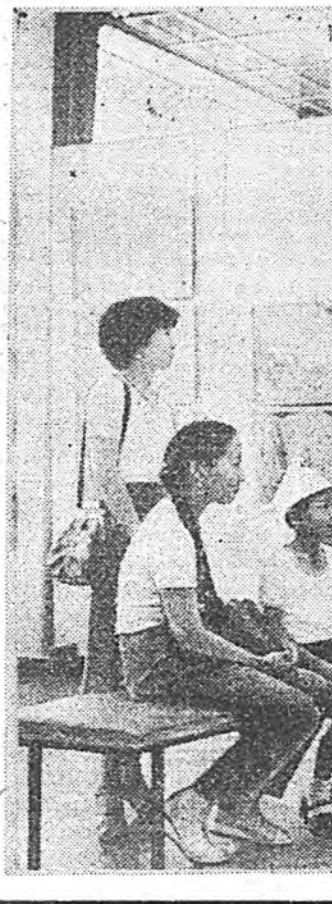
Мүнөө жэлдэ Яруунада хура бороо ехээр орожо, гол герход, Үдэ гол олон газарта эрһеһээ халаад, районий тэрашад, малшадта горитойһон һавд хэнхэй. Төдэ тэдэр зориг хүслөөе гүйсэд дүүрэн эслүүлэн, түхэр үеһе дабажа байһай.

...Үдэр бүри һайхан энэ бай- шангай үүдэе юрын үдэршые хүнүүд онсолон нэгэ мэдрэл- тэйгээр татажа ородог гэгшэ ааб даа. Искусствын шидэтэ оршондо абхаха байһан хүн- нэй ухаан эсдэхилнэ эхлэһэн- гүй хүлэгдэг бшуу. Харин мү- нөөдөө... Хотымнэй үйлсэ гүдэмжүүдтэ, үдэр бүрин- мнэй ажал хэрэгүүдтэ, зон нү- хэдэймнэй шөг шарайнуудта — таа хаангүй жабаланта һайндэрэй амьскалалы элээр мэдрэгдэжэ байхада, уран зу- рагай музейн залнуудта ойн