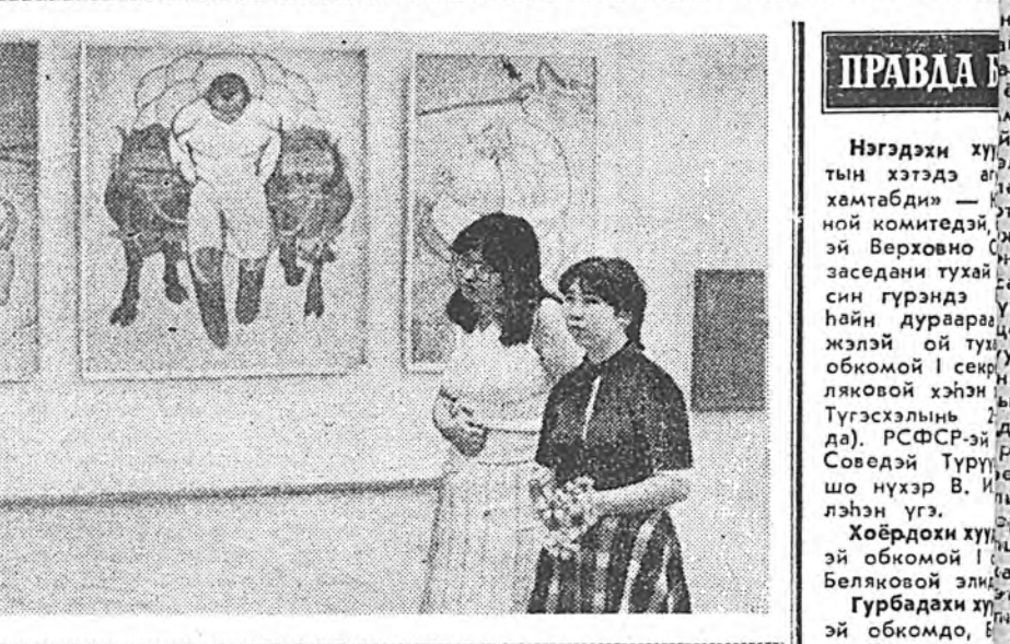
Улаан лентэ хайшалгадаба. Баясма һонирхолтой жэгтэй һайхан мэдрэлдэ абтан, сугларгешад харалгын залнууд руу тэгүүлнэ...

...Үдэр бүри һайхан энэ бай- шангай үүдэе юрын үдэршые хүнүүд онсолон нэгэ мэдрэл- тэйгээр татажа ородог гэгшэ ааб даа. Искусствын шидэтэ оршондо абхаха байһан хүн- нэй ухаан эсдэхилнэ эхлэһэн- гүй хүлэгдэг бшуу. Харин мү- нөөдөө... Хотымнэй үйлсэ гүдэмжүүдтэ, үдэр бүрин- мнэй ажал хэрэгүүдтэ, зон нү- хэдэймнэй шөг шарайнуудта — таа хаангүй жабаланта һайндэрэй амьскалалы элээр мэдрэгдэжэ байхада, уран зу- рагай музейн залнуудта ойн