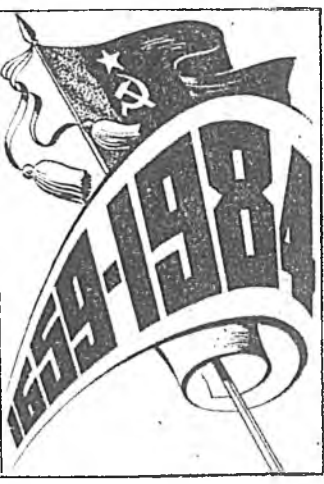
Тань тулалхан байна. Иимэ өхө удах шанартай хэрэг нэн түрүүн ород арадай туйла...

— Түүхэтэ болохон зарим үйлэ хэрэгүүд арадуудай ухаан бодолдо маргатайгайгөөр хадугадахаа гадна он жэлүүдэй ошохо тума ушур хурсаар гүн ухаа элэрхилдэг байна. Россин гүрэнэй бүрдэлдэ Буряагай оройн хайн дураараа орохоор ушур эгээл тинээ түүхэтэ үйлэ хэрэгүүдэй нэгэн мүн.