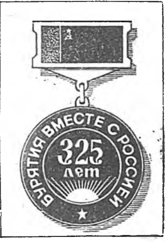
Түгээл, Эхниний 1-дэм нурга.