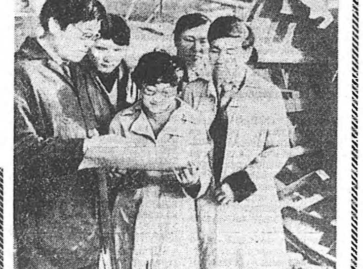
Улаан-Батарай комбинат байгуулагдахаар 50 жилингээ ойе хаяхан тэмдэглэбэ.

ГАВАНА. Республикын промшленностиин энэ шухала халбарин мэрэгжэлтэдэй нэгдэлхи наушна зүблөөн дээрэ Кубын саахарай промшленностиин хүгжэлтын хараа замууд зүбшэн хэлсэгдэбэ.