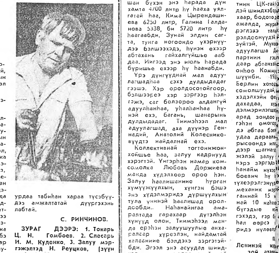
урдаа табиан хараа түсбүү-дэ амжалтатай дүүргэхинэ лабай.

— Бидэ мүнөө Т-40, Т-25, Т-16 түхэлэй тракторнуудыг