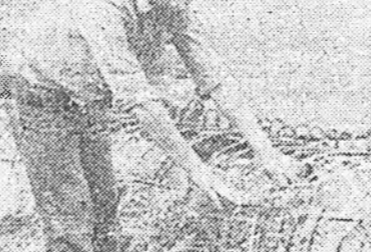
Малай тэжээл бэлдэхэдэ дээрэ 18 коммунист элбэг зынонуудта хүдэлмэришд дунда ажалай журам хайжаруулха эрэгтэ, социалс мурсыөөс эмхидхэлгэдэ, нитэ-политическэ хүдэлмэри абуулгада эхэ нүүлэ үзүүлэбэ.

«Забайкалец» совхозой хүдэлмэришд, механизаторууд, коммунистууд нитын гээлтэ манда тэжээл бэлдэхэдэ дээрэ эмхидхэл хайтайгаар, эрш эхэтэйгээр ажаллажа, хани амжалта тулажа байнаха. Энэ совхоздо түгээс оныхо-жорюулагдаһан гурбан зыно үблэ хуряалгада ябан. Мүн зыно бүхэндэ морин кисткаар, гар жегуурар сабахча хүнүүд гаралсанхай.