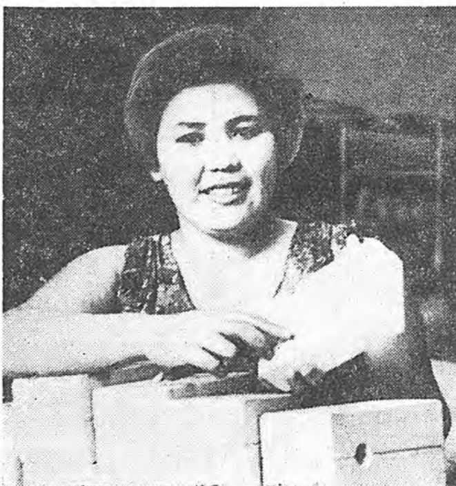
Гарай бэлэгүүдэ бүтээгд Улаан-Удын заводой керамическа цехэй хүдэлмэрилгэгшэд оройной предприятинуудай түрүү онол арганууды ажалдаа хэрэглэхэ гэжэ ходоодо оролдодог. Мүнөө шудхалаа хэдэг уастагой хүдэлмэришэд нэгэ нарядаар ажалладаг болонхой.