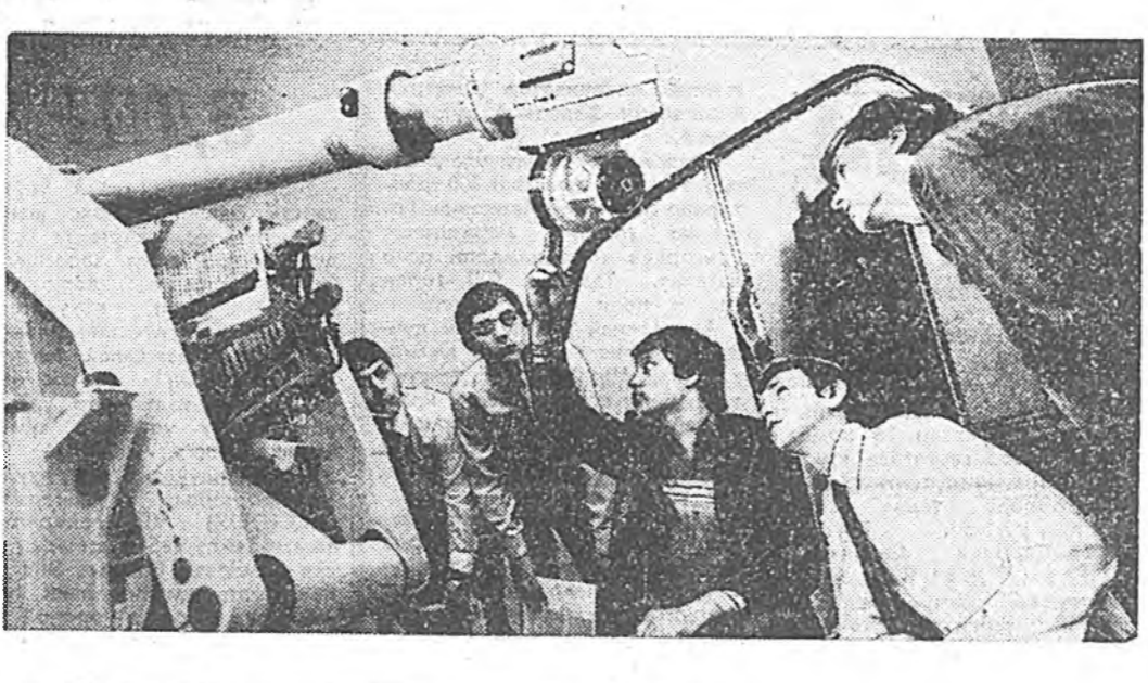
Укриннын таряан ажалай эр-дэм шэнжэлгын институтай селекционерүүдэй хил бол-гоһон сортын хара таряан...