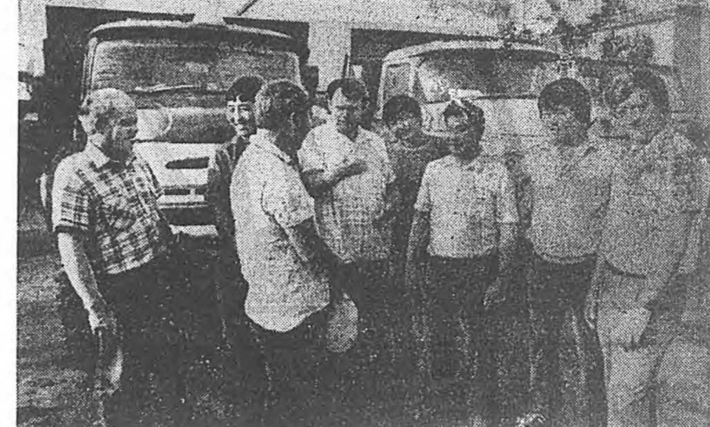
Россин гүрэнэй бүридэлдэ хальмаг арадай хайн дураараа орохоор 375 жэлэй ойн худалдээдэ дэлгэрэн социалис мурьсеондэ хам оролсонон манай заводой коллектив ажалдаа муну бэшэ үр дүнгүүдые туллана.