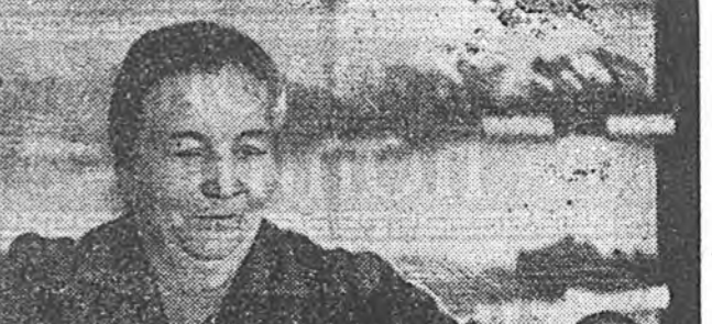
Ивалга хууринай түбтэ ор-шодог «Обувь» гэжэ мага-зница хүн зон ходоодо олоор...