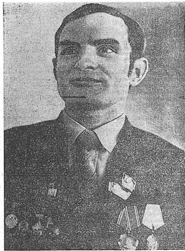
ВЯЧЕСЛАВ ИВАНОВИЧ АКСЕНОВ.