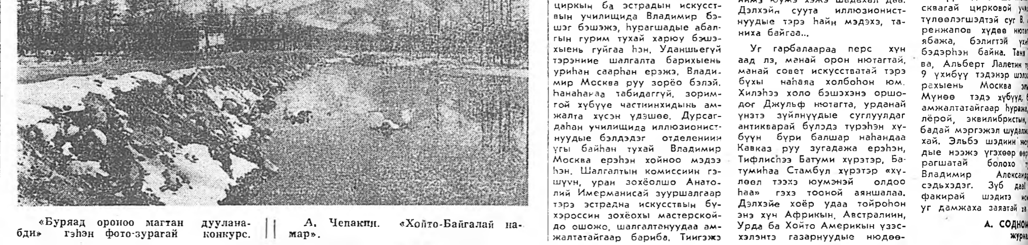
«Буряад ороноо магтан дуулана» А. Чепакпи. «Хойто-Байгалай пар»

Харин Одер мурэни үнн хойшоо тэгүүлээр лэ байба. Кэчондэн аблан дүгээдэ