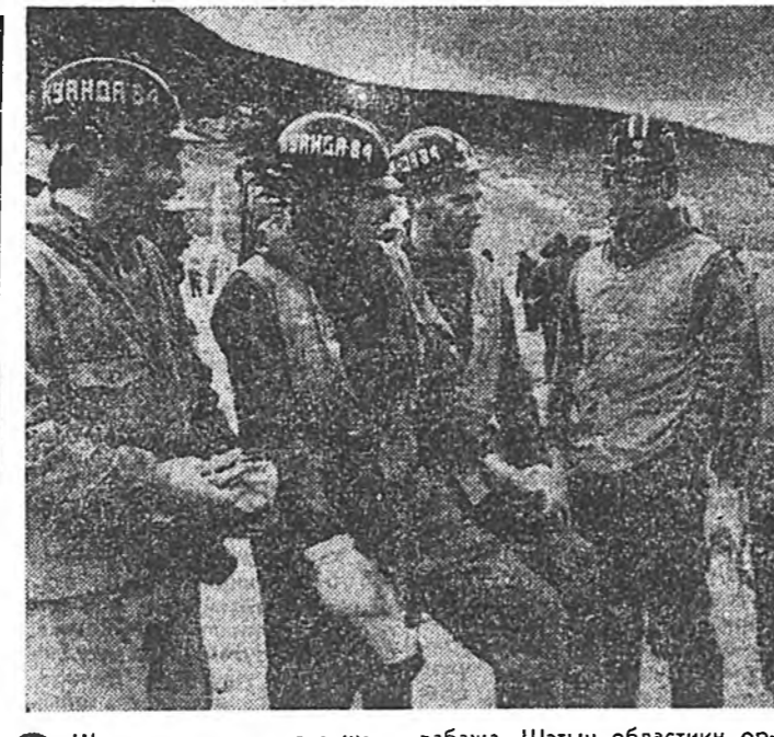
Шухалын шухала удаа шагнараг гайхамжаг БАМ-ые бүхы ороннай барина. Тэрэний аша тунаар Байгал-Амарай түмэр замаар поездуудай хооро ябалга жэлээр урид нээгдэбэ бшуу. Габшагай ажалараа суурхагшадые тоолохо барамээр бэшэ.

Тусгай үүргийн харюу энд тобшохоор толилогдоно. нүүдлээс багасгах тухай мэдээсэгдэнэ. Депутатууд бүлэгүүд кварталдаа 2-3 дахин засагдани үнэгэрэгдэг. Нүүрийн тосгондоо модо тариха, болбосон түгээлтийг болгохо, ариг сүлбэрлэе сахиха тухай, хунгуулин округуудта депутатуудай ябуулдаг хүдлэмэри, дайнай ба ажалай ветерануудай гэр бонра заахарилха гэхэ мэтэйшлэн асуудалууд эбушгэгдэнэ. Эдэ бүлэгүүд хунгуулин нүүдтэй, милициин хүдлэмэрилгэгшэдтэй хүдлэж сүүдүүдэй нэгт холбоотой юм. Бүлэгэй засагданууд дээрэ ажалай журам эбдэнэн гү, али гэрэгтэ шууяа татадаг хүнүүд хэдэ дахин зүбшэн хэлсэгдэнэ.