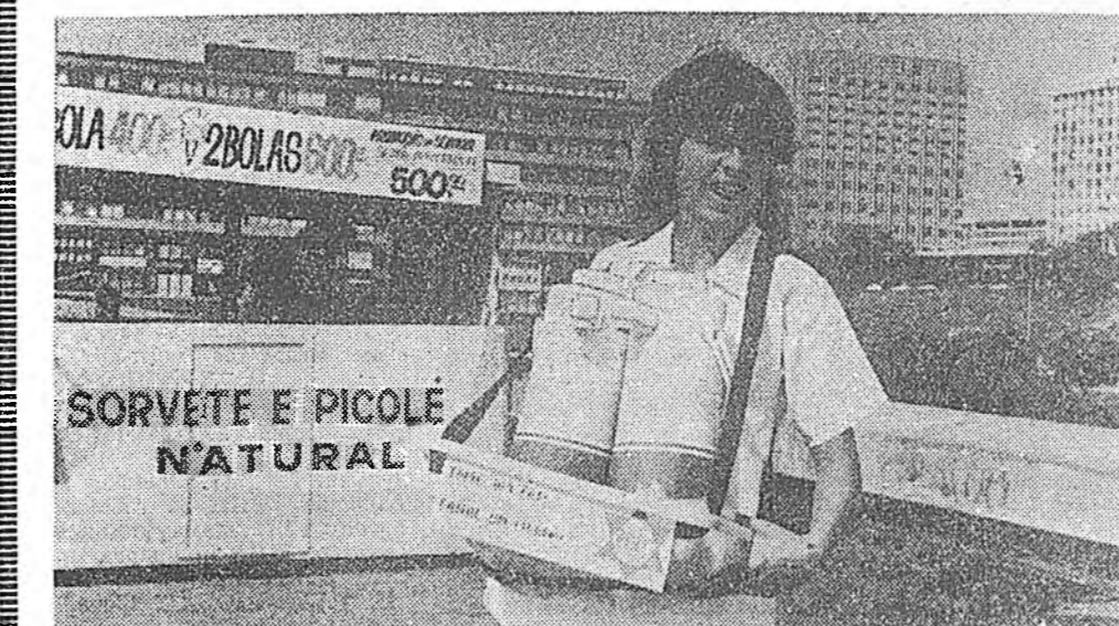
Бразили. Ороной шэнэ нигслэ Бразилиа хотын үйсэдэ. Кофе наймаалдаг басагай.

КПСС-эй обномой бюро, Буриадай АССР-эй Министруудай Совет, профсоюзудай обномой совет, ВЛКСМ-эй обномой студент-ээрэй 1984 оной ажалай семестрий дүнгүү-дэ харжа үзэбэ. Тинхэдэ КПСС-эй ХХVI сьездын, КПСС-эй ЦК-гай үнүүлэй үеин Пленумуудай, мүн ВЛКСМ-эй XIX сьездын шиндхэбэрнүүдэ бөөнүүлэн, XI табан жэл-лэй дүрбэдхэй жэлэй арадай ажахын түс-бүүдэ дүргэжэ хэрэгтэ студентээрэй об-ластной отряд гортонхойн хубитана оруу-лаа гэжэ тэмдэглэжэ.