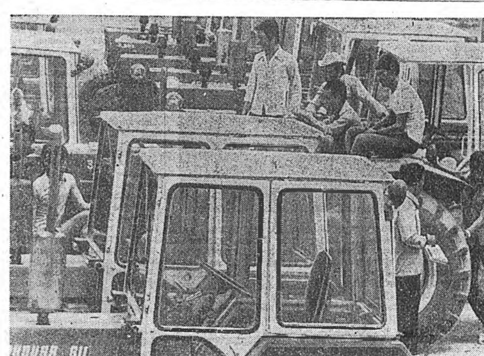
КАМПУЧИ. Энэ орондо Советск Союзай тухаламжар барангар, лопок, иркуруза ургуулаа оныхоожуурагдамал томо ажамжууд байгуулагдана...