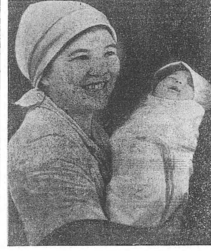
Баргажан нотаг, Байял да- лдай тухай дуулаагүй хүн зон хомор лэ аб даа. Бури эртэ урда саһаа, хатуу шэрүүн жэлнүүдэй үедэ мундэлһэн...

«Манай үеын хүн» гэһэн гаршад доро жэллээ жэлдэ сонсохогодо байдаг конкурсын 1984 оной дунгууд гаргагдаа. Конкурсо уран зохёолшод, журналистууд, худалдаришад ба худөө бэшхэдэ яһала олооро хабаадаа, Тэднэй элэгдэһэн материалнууд соо манай республикн ажалшадай түсэбтэ арбан нэгдэхэ табан жэлэй даабырне болзоороһон урд дүүргэйн түлөө дэлгэрһэн социаль мурисөөнэй хүтэ дээрэ үргэжэ яһанан түрүүшүүлэй туйланан амжалтанууд, амжал хэрэгүүд тухай хэлэгдэһэн байна.