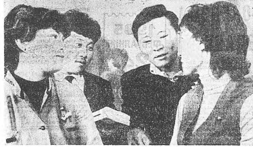
ЗУРАГ ДЭЭРЭ: [үүэн гарнаа] конференци делегатүүд — Улаан-Удын кондитерск фаб...