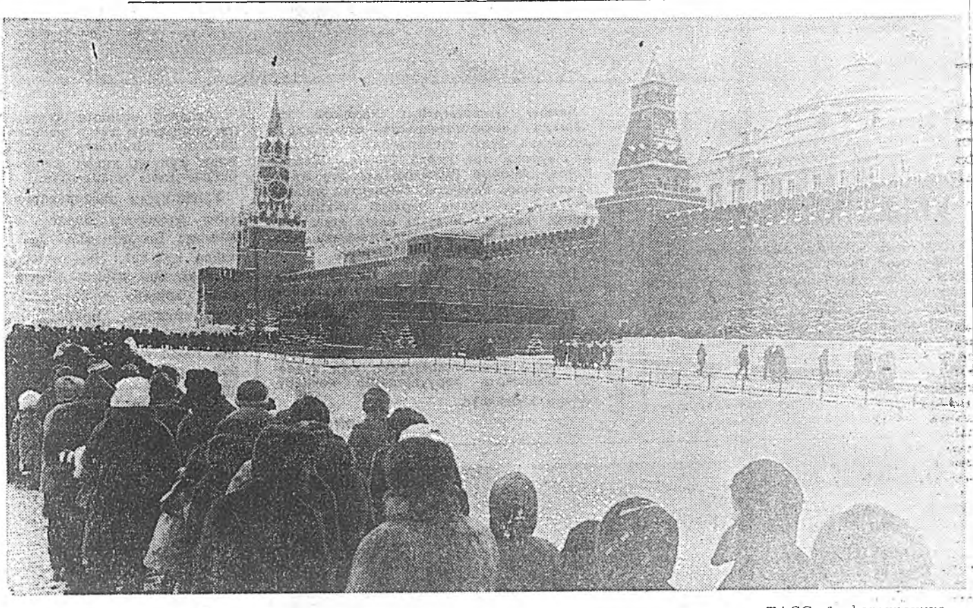
Москва, Улаан талмай. В. И. Ленинэй Мавзолей тээш.

Улаан шулуун мавзолей Олон эрдэнээр гэрэлтэнэл, Олон аралд түүхэд Ошотон байдаг тэмдэг лэ. Хэний нэрэ элн бэ? Хэний нэрэ мүнхэ бэ? Тулхан собонон ардад Хэн түрүүн наагданаб, Тэрэ тэндэ нойрсонол. Юундэ тингэмэ нойрсонол? Тэрэ тэндэ гэрэлтэнэл, Юундэ тингэмэ хайхан бэлэй? Тэрэ тэндэ гэрэлтэнэл, Юундэ тингэмэ хайхан бэлэй? Хэн мэргэн дэлгээ нэм? Буурай дарлагданаб ардад Хэн эсэг болоо нэм? Хэнэй хүбүүн халаан бэлэй? Хэнэй хүбүүн урихан бэлэй? Угирхан ялархан ардад Хэн жолоо болоо бэлэй, Уншэрэн хэвэрэн ардад Юундэ тингэмэ нойрсонол? Тэрэ тэндэ гэрэлтэнэл, Юундэ тингэмэ хайхан бэлэй? Тэрэ тэндэ гэрэлтэнэл, Юундэ тингэмэ хайхан бэлэй? Хэн мэргэн дэлгээ нэм? Буурай дарлагданаб ардад Хэн эсэг болоо нэм? Хэнэй хүбүүн халаан бэлэй? Хэнэй хүбүүн урихан бэлэй? Угирхан ялархан ардад Хэн жолоо болоо бэлэй, Уншэрэн хэвэрэн ардад