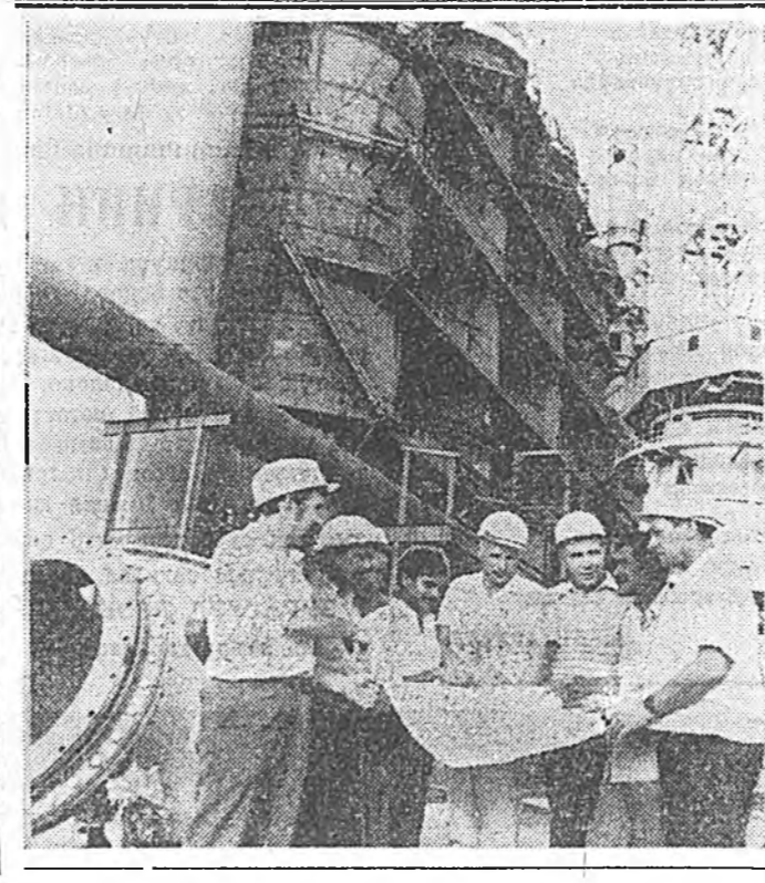
Мүнөө Ойморой совхоз Каванскийн район