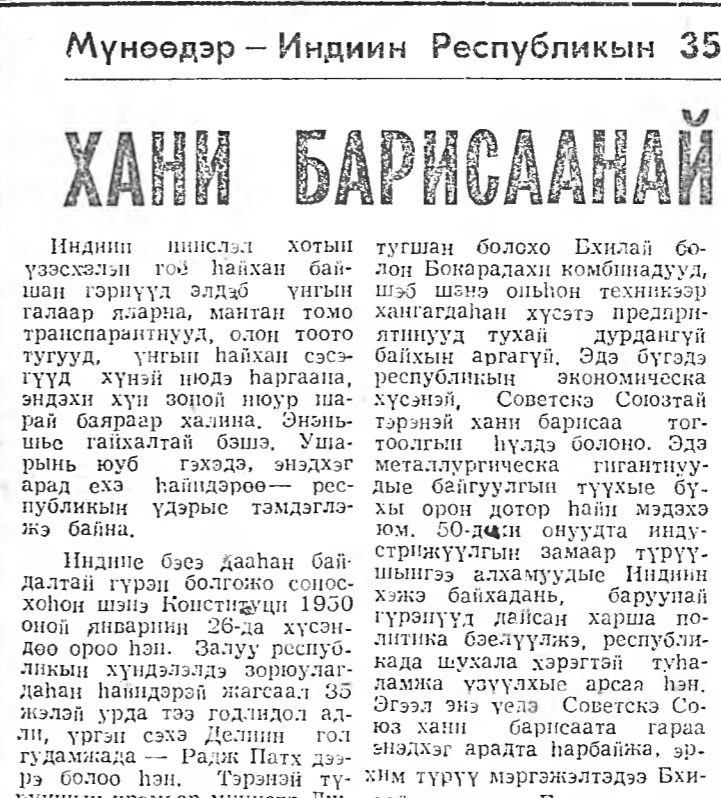
Эдэ заводуудай баригдахтай хамта, совет-индини экономическа, эрдэм-техникни үрэ түгээ харилсаанай үндэһэй һуурь табилаанай байгаа.

Индин шислэд хотын үзэсхэлэн гоё найхан байсан гэрнүүд элдэ үнгин галаар яарна, манган томо транспарантууд, олон тоото тугууд, үнгин найхан сэтгэгүүд хүнэй ноёд харгаана, эндэхин хүн зоной ноур шарай барлаар халина. Энэһын гэжэ гайхалтай бэш, Ушарын юуб гэхэдэ, энэхэдэ арад эхэ найхээрөө - республикын үдэриэ тэмдэглэжэ байна.