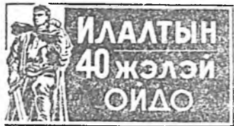
ИЛАЛТЫН 40 ЖЭЛЭЙ ОИДО