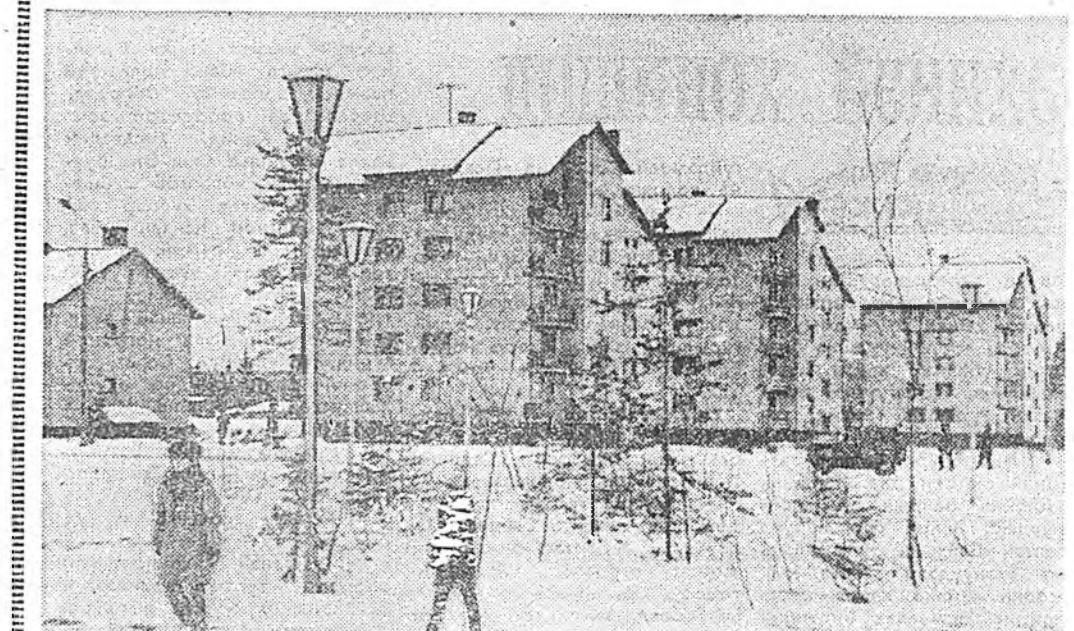
Бам-ай тосхонуудай дундаһаа Ульянов эгээл гоё, өвөрн оорсо шэнжэ шарайтай гэжэ хэлэеэ, ха эс адуу болохогүй. Юуб гэхэдэ «Азербайджанмастерин» барилгад онос түхэлэй проектор дуулан, томо талаһаагүй байрын гэрнүүдэй байн шанартайгаар берика, эндэхи ажануушадые эхэ басыулан байха юм.