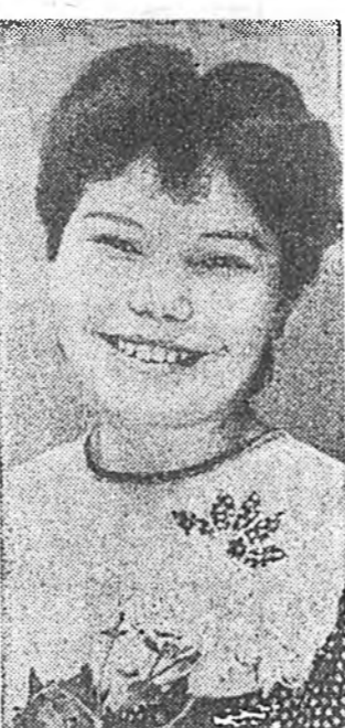
Урихан шарайтай, найман басагадай сценэ дээрэ гарахдаа, нарин сэмбын комбинадай соёлой байшангай харалын зал соо сугларһан хүн зон халуун алыга ташалгаар угтаба...