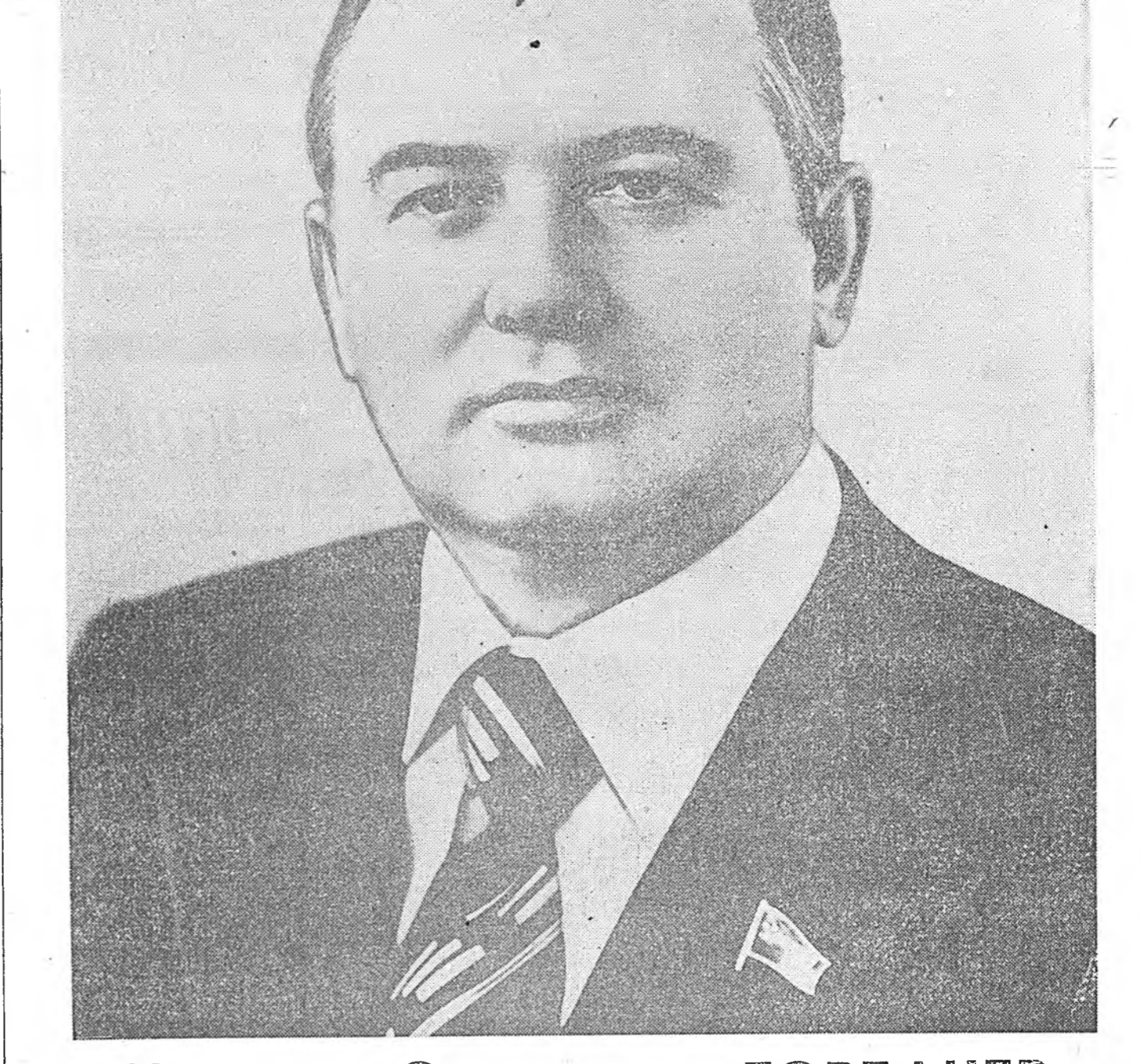
Михаил Сергеевич ГОРБАЧЕВ

Социалис аша дүү оронудай олон талын херисса холбоо саашадан хүгжөөлдэг, социалис экономика интерград бэ-луулгэдэ, социалис хан нэгэдэлэй байдал багтадалда Константин Устинович Черненко ехэ хубитаяа оруула. Тэрэнэй хү-тэлбэри доро нитын элбэ байгуулгатай гэршүүдэй амгалан тайбанаар эрэг ороон һуугын гол ёһонуд бодото дээрэ эрид шангаар, залан сэхээр бэелүүлгэдэг, империализмын ээрэг түрмэхэй ханаашлангундта шиндхы харюу үгтэдэг, империализмын баадханын бүү зобсег үрдилдэн гаргалы бо-лоулы, ядерна дайны аюулы сграхын түлсе, арадуудай аюулуы байдал найдамтайгаар хангахын түлсе эсэшгүй тэм-сэл ябуулагдадаг байгаа.