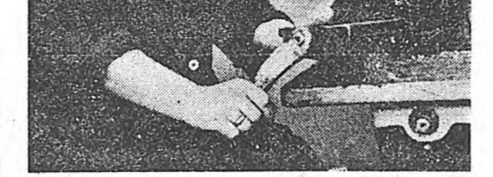
Улаан-Удны кондитерска фабрикын бициклет цех коммунист ажалы үдэр хүдэлжэ