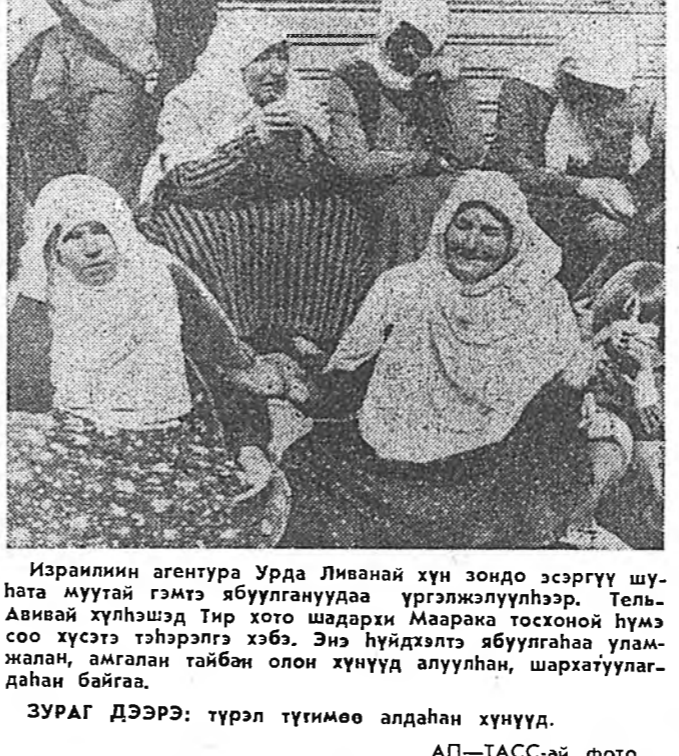
Израилин агентура Урда Ливанай хү зондо ээргүү шуһата муухай гэмтэ ябуулагшаа үргэлжлүүлээр...